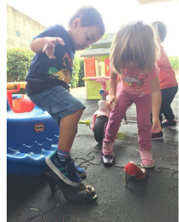
Cefa Asili S.r.l.

potenzialità, intelligenti, duttili, trasformabili ed evocativi. Quindi i materiali messi a disposizione dei bambini sono selezionati in base a criteri non commerciali, ma di sostegno alla creatività personale nel pieno rispetto delle normative in materia di sicurezza ed igiene. Fare attività all'asilo nido significa mettere il bambino in condizione di interrogare la realtà, di provare, di entrare in contatto con le cose, valorizzando le potenzialità, le risorse e le molte intelligenze dei bambini e delle bambine.